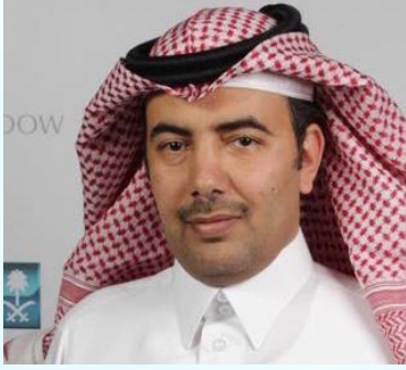
سعادة الأستاذ سعود بن حسين السبيعي رئيس مجلس إدارة جمعية المسؤولية المجتمعية المملكة العربية السعودية