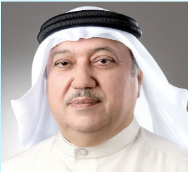
سعادة البروفيسور يوسف عبدالغفار رئيس الهيئة الاستشارية للاتحاد الدولي للمسؤولية المجتمعية - عميد برنامج السفراء الدوليون للمسؤولية المجتمعية مملكة البحرين