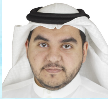
سعادة الدكتور عبدالرحمن سالم البليهي رئيس مجلس جمعية تحسين تجربة المريض المملكة العربية السعودية