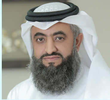
سعادة الدكتور عبدالوهاب الزهراني خبير تطبيقات التنمية المستدامة المملكة العربية السعودية