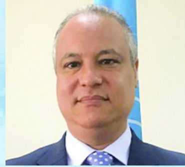
سعادة الأستاذ خالد خليفة الممثل الاقليمي لمفوضية شؤون اللاجئين لدى مجلس التعاون الخليجي منظمة الأمم المتحدة