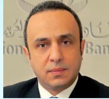
سعادة الأستاذ وسام حسن فتوح أمين عام اتحاد المصارف العربية السفير الدولي للمسؤولية المجتمعية جمهورية لبنان