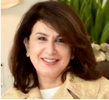
سعادة الشیخة عزة جابر العلی الصباح مؤسس ورئيس مجلس إدارة جمعية السدره للرعاية النفسية لمرضى السرطان دولة الكويت