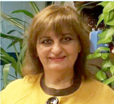
سعادة المستشارة ابتسام القعود رئيسة المنظمة الدولية لتمكين المرأة وبناء القدرات دولة الكويت