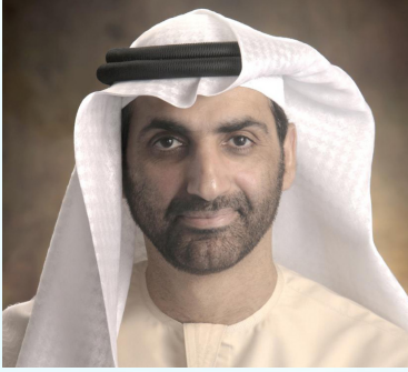
سمو الشيخ الدكتور عبدالعزیز بن علی النعیمی المستشار الیئنی لحكومة إمارة عجمان . الرئيس التنفيذي لجمعية الاحسان الخيرية دولة الامارات العربية المتحدة