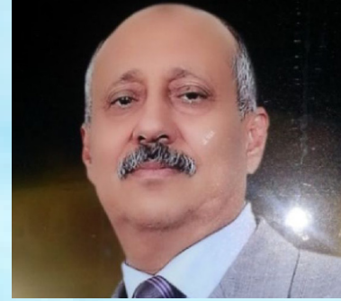
سعادة البروفيسور داود عبد الملك الحدابي مدير المعهد العالمي لوحدة المسلمين الجامعة الإسلامية العالمية ماليزيا مملكة ماليزيا الاتحادية