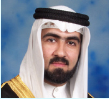
سعادة الدكتور عادل أحمد المرزوقي نائب رئيس مجلس إدارة الشبكة الإقليمية للمسؤولية الاجتماعية مملكة البحرين