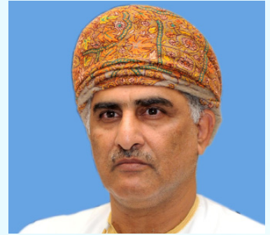
المكرم حاتم الطائي عضو مجلس الدولة العضو الشرفي للاتحاد الدولي للمسؤولية المجتمعية سلطنة عمان