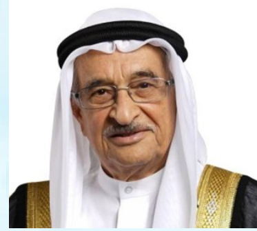
معالي الفريق طبيب الشيخ محمد بن عبدالله آل خليفة رئيس المجلس الأعلى للصحة مملكة البحرين