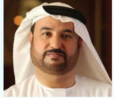
سعادة الأستاذ جمال بن عبيد البح رئيس منظمة الأسرة العربية السفير الدولي للمسؤولية المجتمعية دولة الإمارات العربية المتحدة