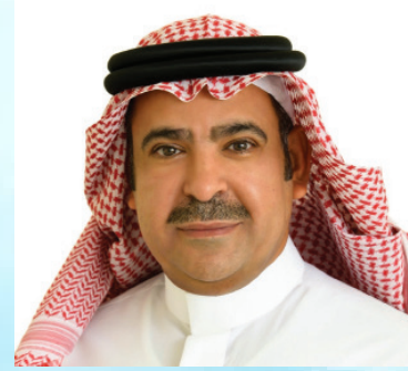
سعادة الدكتور يوسف عثمان الحزيم الأمين العام لمؤسسة العنود الخيرية الرئيس التنفيذي لمؤسسة العنود للاستثمار المفوض الأممي للترويج لأهداف الأمم المتحدة للتنمية المستدامة المملكة العربية السعودية