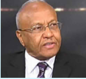
سعادة البروفيسور مأمون محمد علي حميدة رئيس مجلس أمناء جامعة العلوم الطبية والتكنولوجيا جمهورية السودان