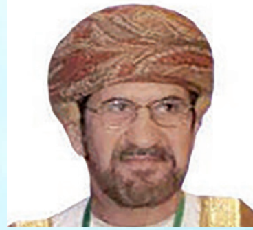
المكرم الشيخ علي بن ناصر المحروقي عضو مجلس الدولة السفير الدولي للمسؤولية المجتمعية سلطنة عمان