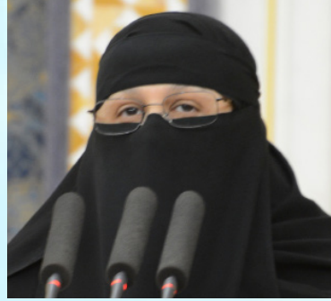
سعادة الدكتورة زينب أبوطالب عضو مجلس الشورى العضو الشرفي للاتحاد الدولي للمسؤولية المجتمعية المملكة العربية السعودية

رئيسة وكالة استجابة لإدارة الأزمات والكوارث السفير الدولي للمسؤولية المجتمعية المملكة العربية السعودية