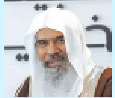
سعادة الشيخ أحمد الصبان مستشار ووكيل وزارة الشؤون الإسلامية (سابقا) - العضو الفخري للشبكة الإقليمية للمسؤولية الاجتماعية المملكة العربية السعودية