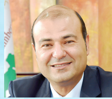
سعادة الدكتور خالد حنفي الأمين العام لاتحاد الغرف العربية جمهورية مصر العربية