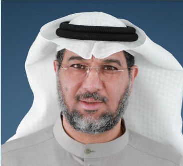
سعادة الدكتور نبيل بن حمد العون رئيس مجلس إدارة جمعية السلام للأعمال الإنسانية والخيرية دولة الكويت