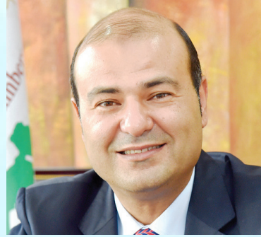
سعادة الدكتور خالد حنفي الأمين العام لاتحاد الغرف العربية جمهورية مصر العربية

مؤسس ورئيس برنامج أصدقاء الطبيعة السفير الدولي للمسؤولية المجتمعية دولة قطر