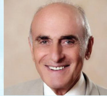
سعادة السيد منيب المصري رئيس مجلس إدارة صندوق ووقفية القدس السفير الدولي للمسؤولية المجتمعية دولة فلسطين