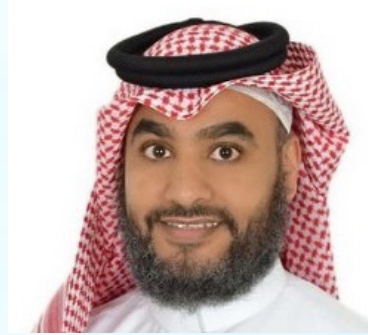
سعادة المستشار فايز سفر العمري الرئيس التنفيذي لمجموعة الخبر العالمي للاستشارات والتطوير المملكة العربية السعودية