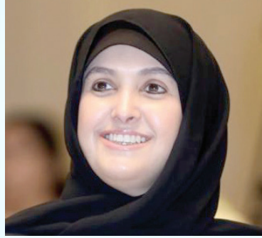
سعادة الشیخة سهیلة سالم الصباح السفير الدولي للمسؤولية المجتمعية دولة الكويت