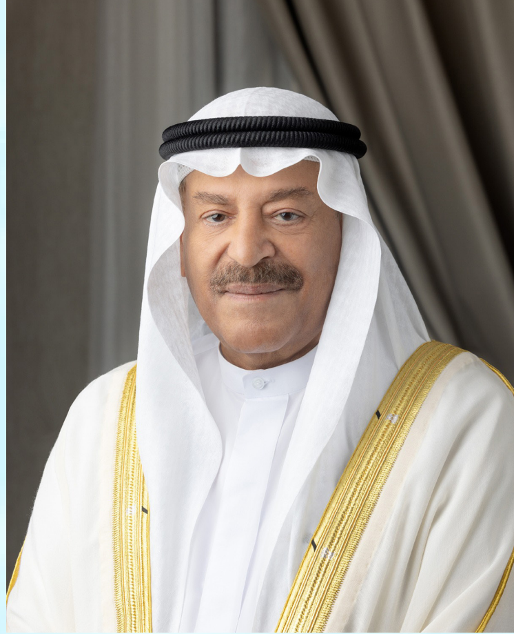
معالي السيد علي بن صالح الصالح رئيس مجلس الشورى بمملكة البحرين