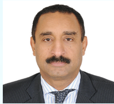
سعادة الدكتور هاشم سليمان حسين رئيس مكتب ترويج الاستثمار والتكنولوجيا التابع لمنظمة الأمم المتحدة للتنمية الصناعية (اليونيدو) السفير الدولي للمسؤولية المجتمعية مملكة البحرين