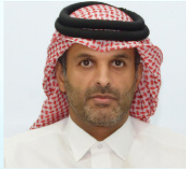
سعادة الشیخة الدكتور ثاني بن علي بن سعود آل ثاني محامي وعضو مجلس إدارة مركز قطر الدولي للتوفيق والتحكيم السفير الدولي للمسؤولية المجتمعية دولة قطر