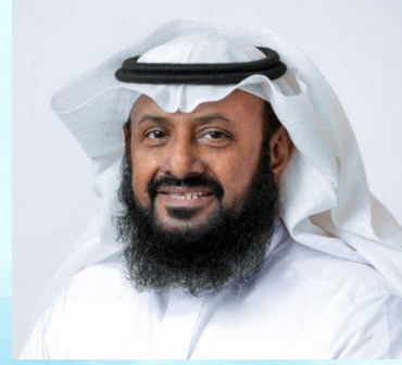
سعادة الدكتور حسن الشريم الأمين العام لمؤسسة السبيعي الخيرية المملكة العربية السعودية