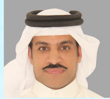
سعادة المستشار جابر الرويعي رئيس مركز الاستشارات المسؤولة بالشبكة الإقليمية للمسؤولة الاجتماعية مملكة البحرين