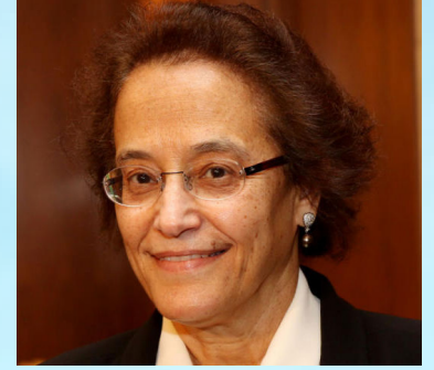
سعادة السفيرة أمل مجرن الحمد مساعد وزير الخارجية للشؤون الاقتصادية «سابقا» - مستشار التعاون المحلي والدولي بالمعهد العربي للتخطيط دولة الكويت