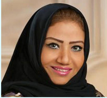
سعادة الدكتورة انتصار أحمد فلمبان

رئيسة وكالة استجابة لإدارة الأزمات والكوارث السفير الدولي للمسؤولية المجتمعية المملكة العربية السعودية