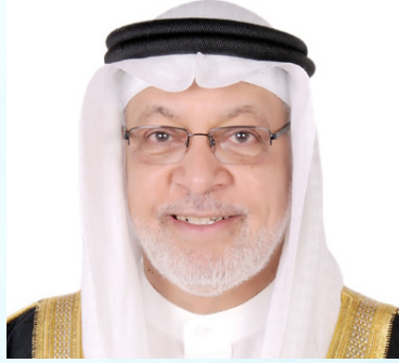
معالي الشيخ دعیج بن خلیفة آل خليفة الرئيس الفخري للجمعية الخلیجية للإعاقه السفير الدولي للمسؤولية المجتمعية مملكة البحرين