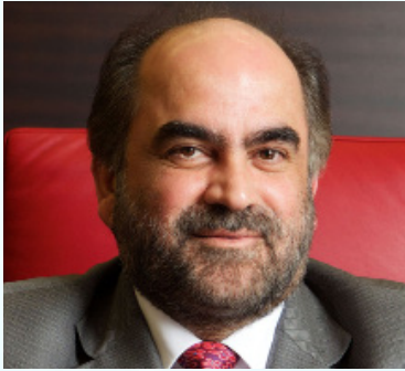
سعادة الدكتور عبدالرحمن جواهري الرئيس التنفيذي لشركة نفط البحرين «بابكو» السفير الدولي للمسؤولية المجتمعية مملكة البحرين