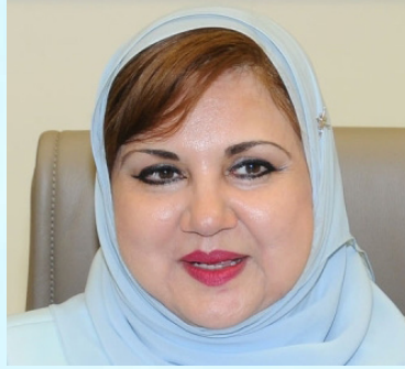
معالي الدكتورة سعاد بنت محمد بن علي اللواتية وزيرة ونائبة رئيس مجلس الدولة «سابقاً» سلطنة عمان