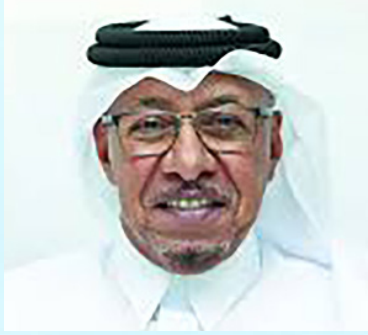
سعادة الدكتور سيف بن علي الحجري

مؤسس ورئيس برنامج أصدقاء الطبيعة السفير الدولي للمسؤولية المجتمعية دولة قطر