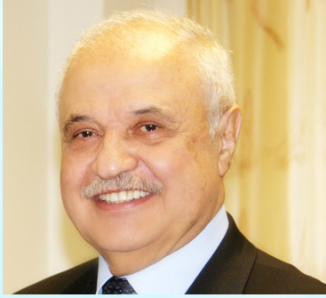
سعادة الدكتور طلال أبوغزالة رئيس مجلس إدارة مجموعة طلال أبو غزالة السفير الدولي للمسؤولية المجتمعية المملكة الأردنية الهاشمية