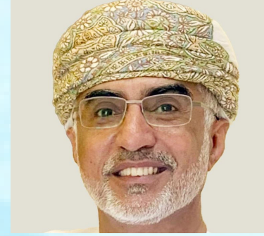
سعادة البروفيسور عمر بن عوض الرواس الأمين العام لمجلس التخصصات الصحية بمجلس وزراء الصحة العرب جامعة الدول العربية - سلطنة عمان