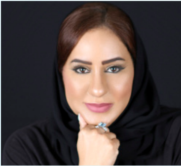
سمو السيدة الدكتورة بسمة آل سعيد السفير الدولي للمسؤولية المجتمعية سلطنة عمان