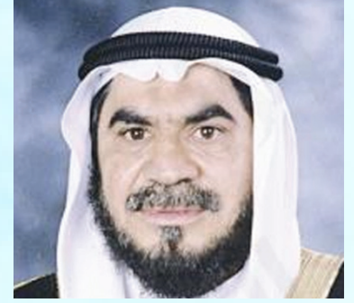
فضيلة الشيخ الدكتور مساعدة محمد مندني رئيس مجلس إدارة جمعية التكافل الاجتماعي لرعاية السجناء المعسرین السفير الدولي للمسؤولية المجتمعية دولة الكويت