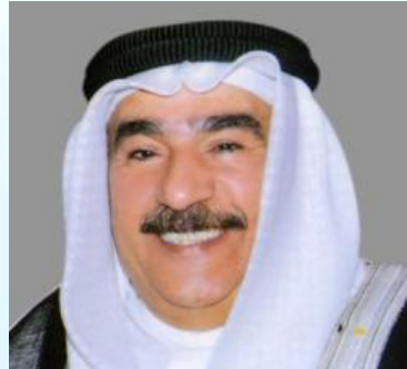
سعادة الدكتور حسن ابراهيم كمال عضو مجلس أمناء المؤسسة الملكية للأعمال المستدامة السفير الدولي للمسؤولية المجتمعية مملكة البحرين