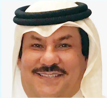
سعادة المستشار عبد الله الضحيان العنزي محامي ومستشار قانوني رئيس مجلس إدارة مركز التنمية المستدامة جمعية المحامين الكويتية دولة الكويت