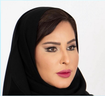
سعادة السيدة شيخة بنت غانم الكبيسي العضو الشرفي الصندوق العربي لرعاية بحوث المسؤولية المجتمعية دولة قطر