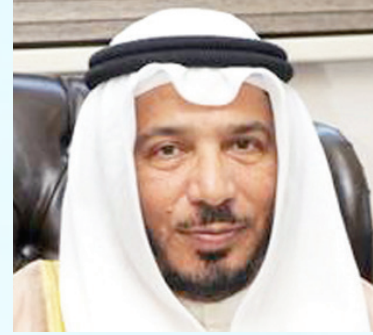
معالي الدكتور عبدالله معتوق المعتوق رئيس الهيئة الخيرية الإسلامية العالمية العضو الشرفي للإتحاد الدولي للمسؤولية المجتمعية دولة الكويت