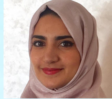
سعادة الأستاذة سلمى بودينه مدير الشبكة الوطنية لبرنامج الاتفاق العالمي للأمم المتحدة المملكة المغربية