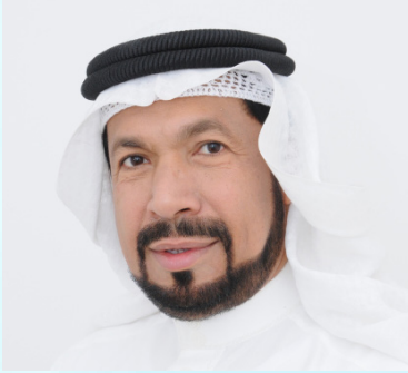
سعادة الدكتور صلاح بن علي محمد عبد الرحمن وزير وبرلماني سابق السفير الدولي للمسؤولية المجتمعية مملكة البحرين