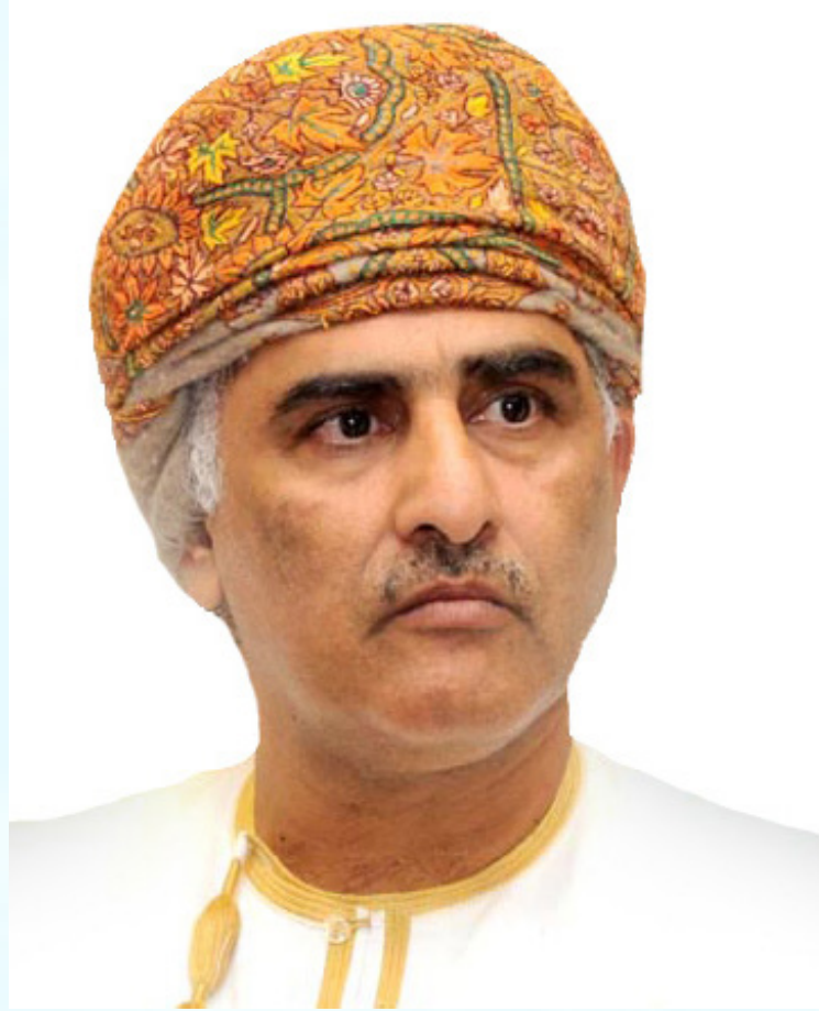
المكرم حاتم الطائي عضو مجلس الدولة العماني سلطنة عمان