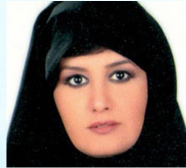
سعادة الشیخة حصه بنت خليفة بن أحمد آل ثاني مبعوث الأمين العام لجامعة الدول العربية لشؤون الاغاثة الانسانية دولة قطر