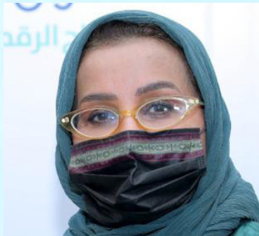
سعادة الأستاذة هدى عبدالعزيز النعيم عضو مجلس شؤون الأسرة و رئيس لجنة كبار السن المملكة العربية السعودية