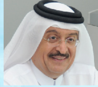
سعادة الدكتور محمد بن سيف الكواري السفير الدولي للمسؤولية المجتمعية دولة قطر