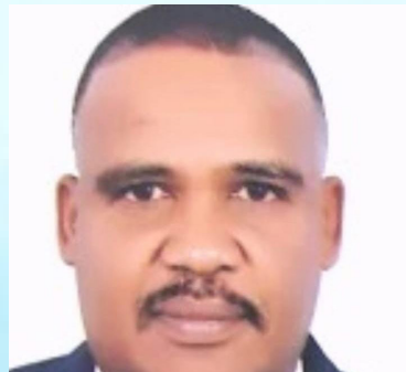
سعادة المستشار إبراهيم أحمد الطيب الماحي مستشار إدارة المنظمات غير الربحية جمهورية السودان