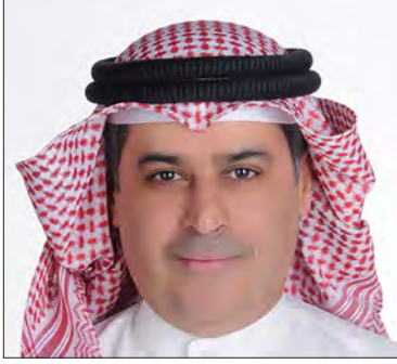
سعادة الأستاذ حسن جاسم الجاسم الرئيس التنفيذي للشبكة الإقليمية للمسؤولية الاجتماعية مملكة البحرين