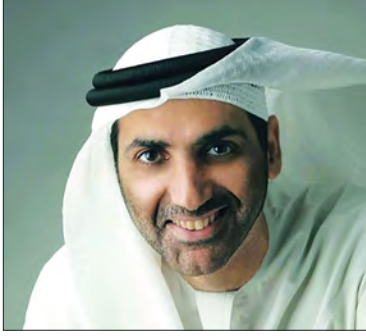
سمو الشيخ الدكتور عبد العزيز بن علي بن راشد النعيمي المستشار البيئي لحكومة أمارة عجمان دولة الإمارات العربية المتحدة