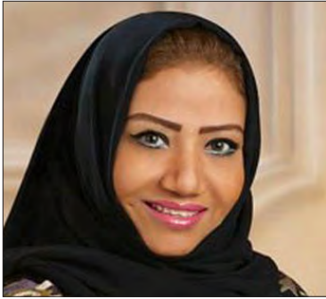
سعادة الدكتورة انتصار أحمد فلمبان رئيسة لجنة المرأة والأسرة بالمنظمة العربية للسلامة المرورية المملكة العربية السعودية