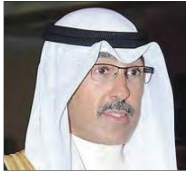
معالي الشيخ فواز الخالد الصباح محافظ محافظة الأحمدى دولة الكويت