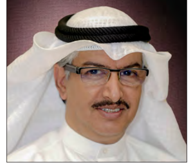
سعادة السيد محمد فلاح فالح العتيبي مدير عام بيت الزكاة الكويتي دولة الكويت