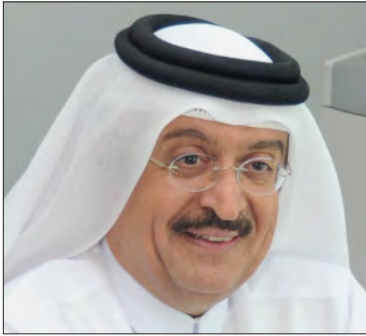
سعادة الدكتور محمد بن سيف الكواري الوكيل المساعد بوزارة البلدية والبيئة دولة قطر