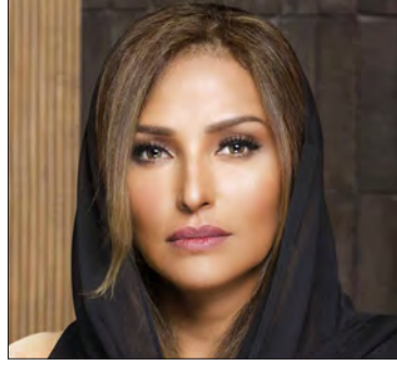
صاحبة السمو الملكي الأميرة نباء بنت ماجد بن سعود بن عبدالعزيز آل سعود الأمين العام لمؤسسة الوليد للإنسانية وعضو مجلس الأمناء. المملكة العربية السعودية