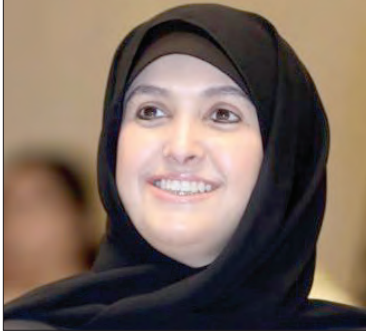
سعادة الشيخة سهيلة سالم الصباح خبيرة تربية دولة الكويت