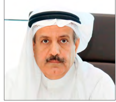
سعادة الأستاذ عدنان أحمد يوسف الرئيس التنفيذي لمجموعة البركة المصرفية مملكة البحرين