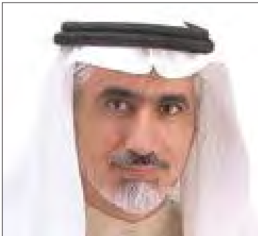
سعادة الدكتور زهير المزيدي رئيس مؤسسة الإعلاميون العرب دولة الكويت