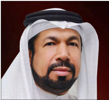
سعادة الدكتور صلاح بن علي محمد عبدالرحمن الرئيس الفخري لجمعية مكافحة التدخين نائب رئيس مجلس النواب الأسبق مملكة البحرين