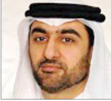
سعادة الأستاذ محمد علي القائد الرئيس التنفيذي لهيئة المعلومات والحكومة الإلكترونية مملكة البحرين