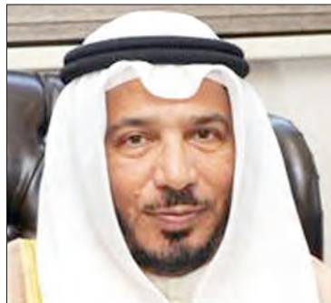
معالي الدكتور عبد الله بن معتوق المعتوق المستشار بالديوان الأميرى رئيس الهيئة الخيرية الإسلامية العالمية المستشار الخاص للأمين العام للأمم المتحدة دولة الكويت