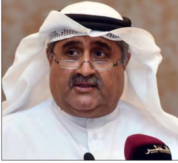
سعادة المهندس أحمد جاسم جولو رئيس إتحاد المهندسين العرب دولة قطر