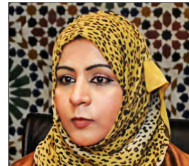
معالي الشيخة عائشة بنت خلفان بن جميل السيابية رئيسة الهيئة العامة للصناعات الحرفية سلطنة عمان