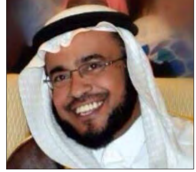
سعادة الدكتور محمد بن عمر علي السيد مدير عام الإدارة العامة لهيئة الهلال الاحمر السعودي بمنطقة جازان المملكة العربية السعودية