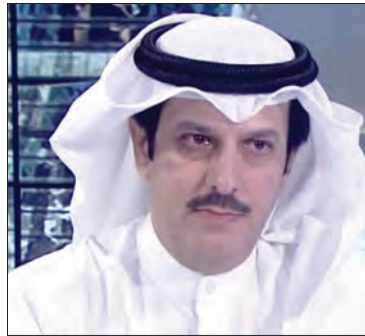
سعادة المستشار بدر المطيري الأكاديمي والخبير في مجال الاعلام والمسؤولية المجتمعية والتنمية المستدامة دولة الكويت