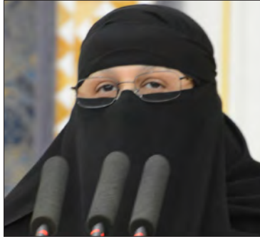
سعادة الأستاذة الدكتورة زينب أبو طالب عضو مجلس الشورى صاحبة مشروع الهيئة الوطنية للمسؤولية الاجتماعية المملكة العربية السعودية