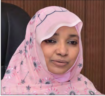
سعادة الدكتورة أمل البكري البيلي وزيرة سابقة وأكاديمية وخبيرة في مجال المسؤولية المجتمعية جمهورية السودان