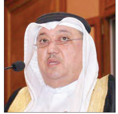
بروفيسور يوسف عبدالغفار رئيس مجلس إدارة الشبكة الإقليمية للمسؤولية الاجتماعية

إننا نأمل أن تكون قد وفقنا الله تعالى عبر هذا التصنيف المهني إلى التعريف بجهود شخصيات عربية أحدثت أثرا علميا ومهنيا إيجابيا في مجتمعاتنا العربية وفي خارجها.