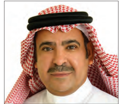
سعادة الدكتور يوسف عثمان الحزيم الأمين العام لمؤسسة العنود الخيرية والرئيس التنفيذي لمؤسسة العنود للاستثمار المملكة العربية السعودية