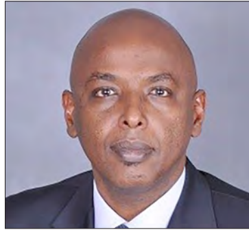
سعادة الاستاذ سعید حرسى رئيس مكتب الأمم المتحدة لتنسيق الشؤون الانسانية (أوتشا) - المكتب الاقليمي في شرق أثيوبيا جمهورية الصومال الديمقراطية