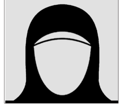
صاحبة السمو الملكي الاميرة عبير بنت عبد الله بن عبد العزيز آل سعود الرئيس الفخري للمنظمة العربية للسلامة المرورية، المملكة العربية السعودية