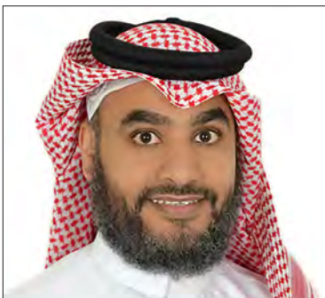
سعادة الأستاذ فايز سفر العمري الرئيس التنفيذي لمجموعة الخبر العالمي للإستشارات والتطوير المملكة العربية السعودية