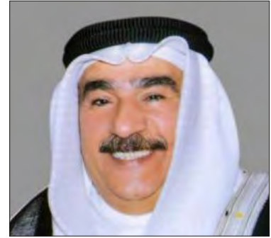
سعادة الدكتور حسن ابراهيم كمال عضو مجلس أمناء المؤسسة الخيرية الملكية مملكة البحرين