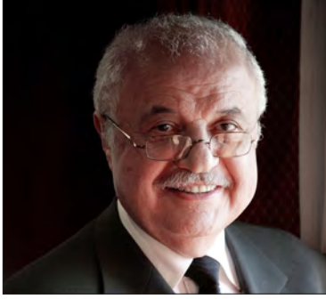
سعادة الدكتور طلال بوغزالة رئيس مجلس إدارة مجموعة طلال أبو غزالة المملكة الأردنية الهاشمية