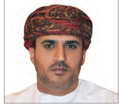
سعادة الشيخ عبدالله بن سالم الرواس رئيس مجلس إدارة المؤسسة الدولية للتنمية المستدامة سلطنة عمان