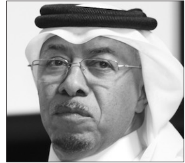
سعادة الدكتور سيف بن علي الحجري مؤسس ورئيس برنامج أصدقاء الطبيعة دولة قطر