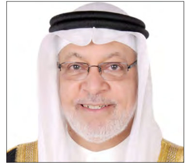
معالي الشيخ دعيج بن خليفة آل خليفة الرئيس الفخري للجمعية الخليجية للاعاقه السكرى الدولى للمسؤولية المجتمعية مملكة البحرين