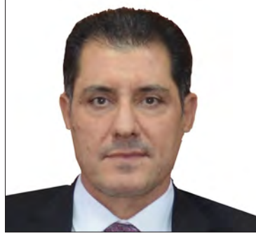
سعادة الدكتور نوري صباح حميد عبطان الدليمي وزير التخطيط جمهورية العراق