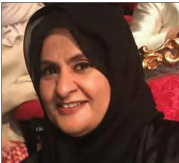
سعادة الشيخة لولوة بنت خليفة آل خليفة نائبة رئيسة مجلس إدارة جمعية النور للبر مملكة البحرين