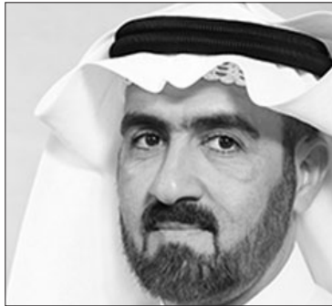
سعادة الدكتور عادل أحمد المرزوقي نائب رئيس مجلس إدارة الشبكة الإقليمية للمسؤولية الاجتماعية مملكة البحرين