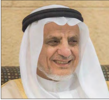
معالي الدكتور عبدالرحمن بن عبدالعزيز السويلم رئيس مجلس إدارة الجمعية الخيرية الصحية لرعاية المرضى «عناية» المملكة العربية السعودية