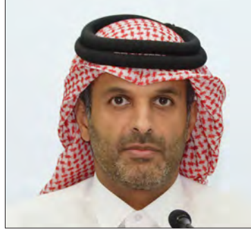
سعادة الشيخ الدكتور ثاني بن علي بن سعود آل ثاني عضو مجلس إدارة مركز قطر الدولي للتوفيق والتحكيم دولة قطر