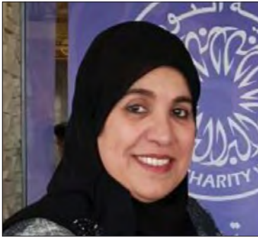
معالي الشيخة نباء بنت محمد آل خليفة رئيسة مجلس إدارة جمعية النور للبر مملكة البحرين