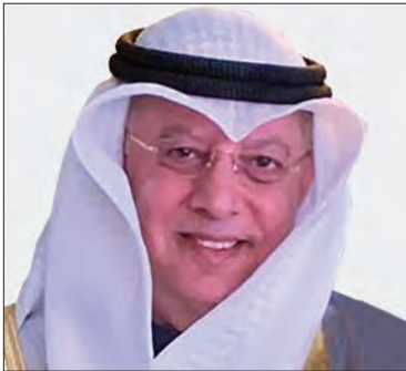
سعادة الدكتور بدرعثمان مال الله مدير عام المعهد العربي للتخطيط ورئيس هيئة تحرير التقرير الوطني للتنمية البشرية لدولة الكويت دولة الكويت