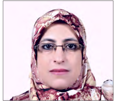
سعادة الدكتورة نعيمة بوعيش رئيسة مركز مارتيل الدولي المملكة المغربية