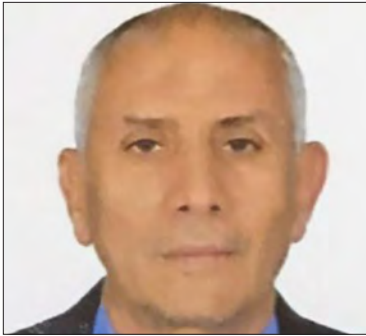
سعادة الدكتور محمد حسن أمين عبدالرحمن مستشار مجلس الوزراء للشؤون الإنسانية مستشار رئيس جامعة عدن لشؤون المشاريع والمنظمات الداعمة الجمهورية اليمنية