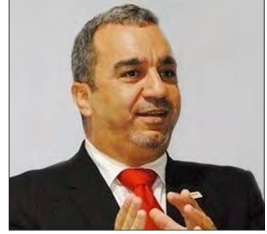
سعادة الدكتور صالح الحموري الخبير في مجالات التطوير والتميز المؤسسي والمسؤولية المجتمعية المملكة الأردنية الهاشمية