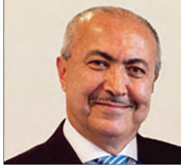
سعادة الدكتور فؤاد مصطفى المخزومي رئيس مجلس إدارة مؤسسة مخزومي الجمهورية اللبنانية